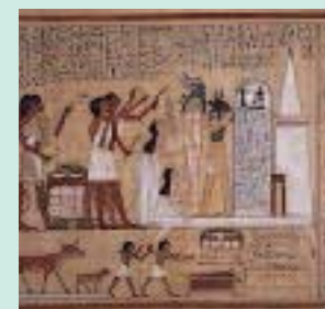
FIGURE 7 : Le dieu Anubis à tête de chien se tient derrière le défunt. Livre des morts British Museum.