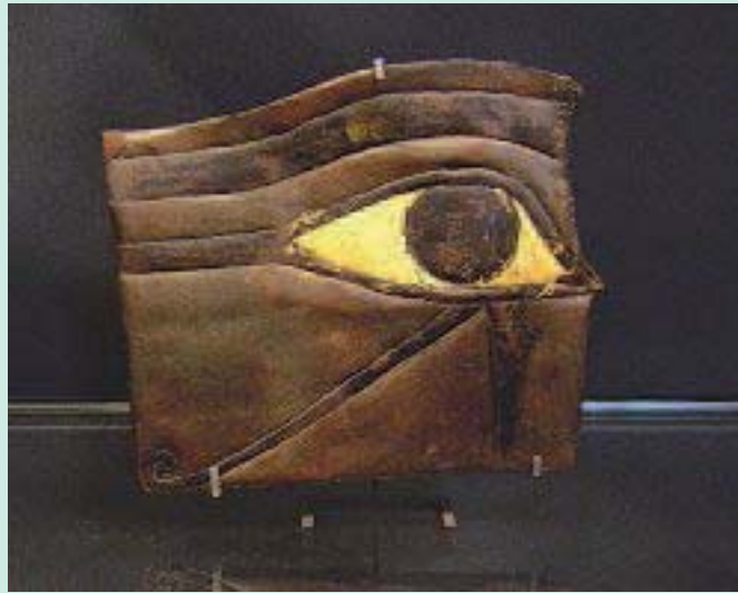
FIGURE 1 : Œil d'Horus Musée du Louvre.

Ces dieux qui ont créé la contention ou l'autre histoire de la contention