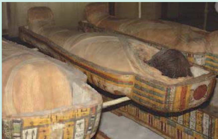
FIGURE 6 : Mummies du Musée Egyptien de Turin.