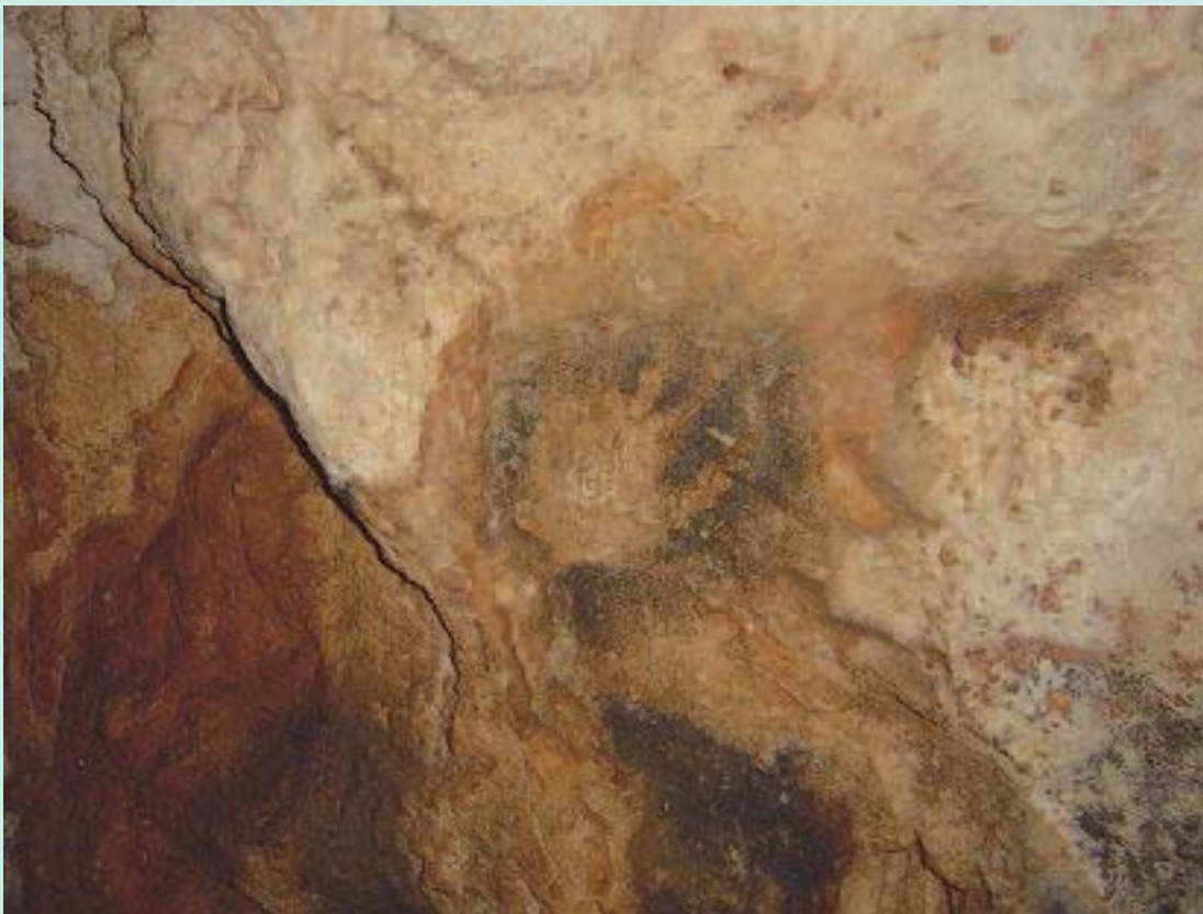
FIGURE 2 : Main négative/ Grotte des Merveilles.