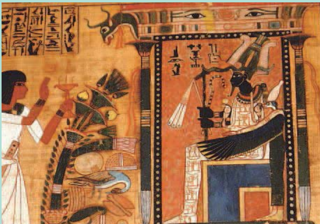
Osiris. Livre des Morts. Musée du Louvre.

Christian Gardon-Mollard , Médecin vasculaire, Phlébologie. 7, avenue de Royat, F- 63400 Chamalières email: christian.gardon-mollard@orange.fr Accepté le 04 avril 2009.