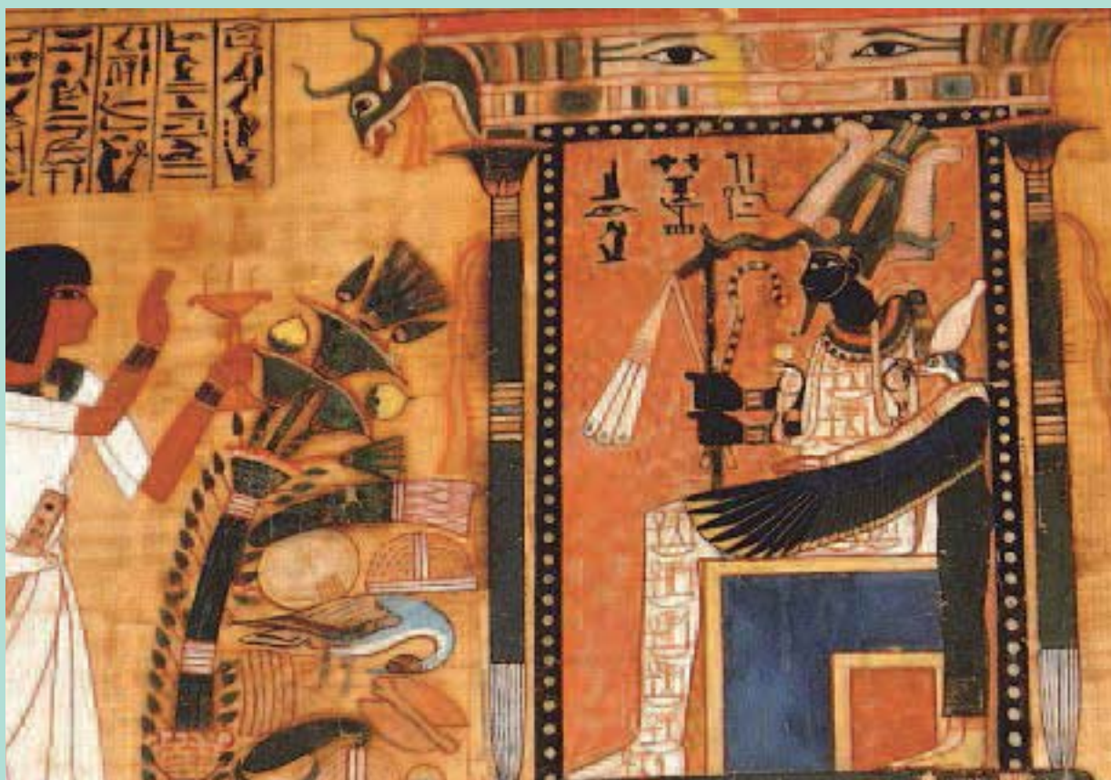
Osiris. Livre des Morts. Musée du Louvre.