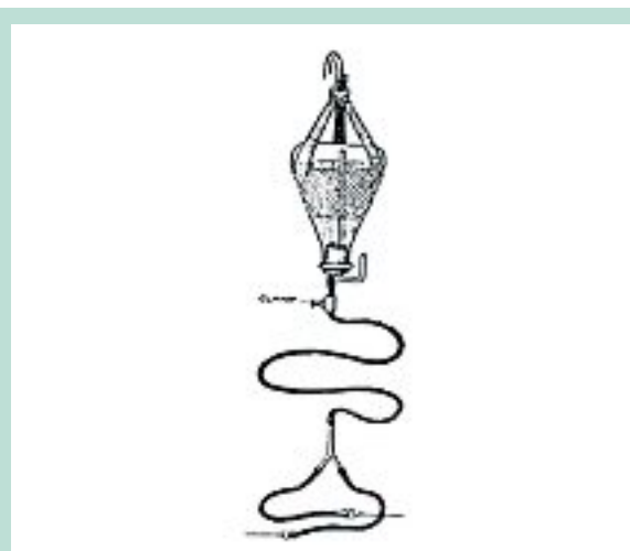
FIGURE 4 : Remplissage par gravité ressemblant au système « pieuvre ».