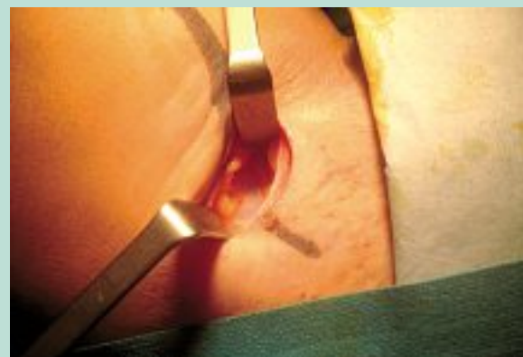
FIGURE 9 : L'hydrodissection. La saphène apparaît dans le liquide d'infiltration, blanche, vasoconstricte, pas le moindre suintement hémattique.

Arracher, invaginer, cuire une veine est a priori un acte agressif chez un sujet vivant et la douleur peut être immédiate, mais aussi en postopératoire immédiat. La présence de cette solution anesthésiante associée à de l'adrénaline à très faible dose va permettre une récupération rapide et un réveil progressif de la zone. La pose d'une contention efficace va prolonger le résultat. L'utilisation d'anesthésiques locaux type Naropen® [16] permet de prolonger ce temps postopératoire.