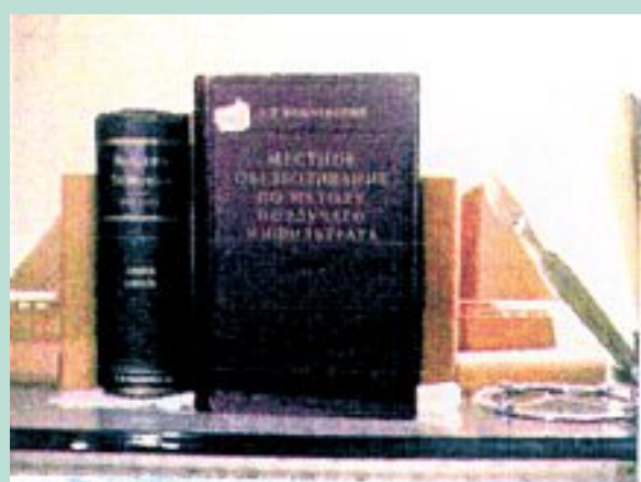
A.V. Vishnevsky's book edited and enlarged by A.A. Vishnevsky