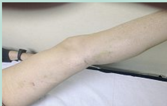
FIGURE 8 : Hématome à J5 après cryo-invagination de la grande saphène.