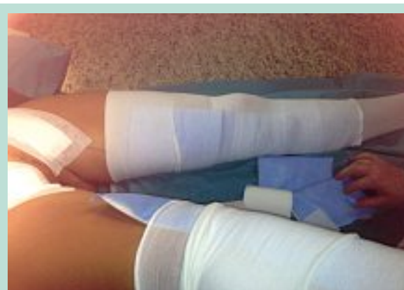
FIGURE 15 : Pose d'une contention avec pansement américain en regard du trajet sur tube compressif, qui sera recouvert d'une contention fixe élasto-compressive, à laisser en place 5 jours.