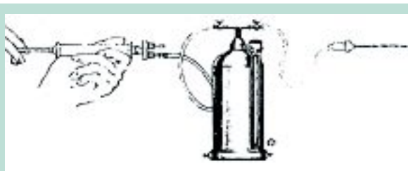
FIGURE 2 : Ancêtre de la pompe à galet utilisée aujourd'hui (depuis 30 ans).