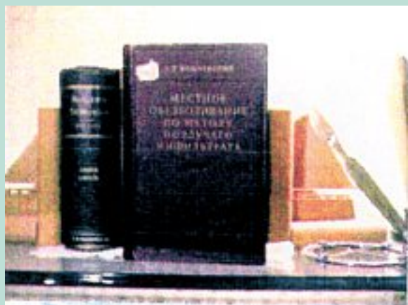
A.V. Vishnevsky's book edited and enlarged by A.A. Vishnevsky FIGURE 1 : Traité de chirurgie de A.A.Vishnevsky.