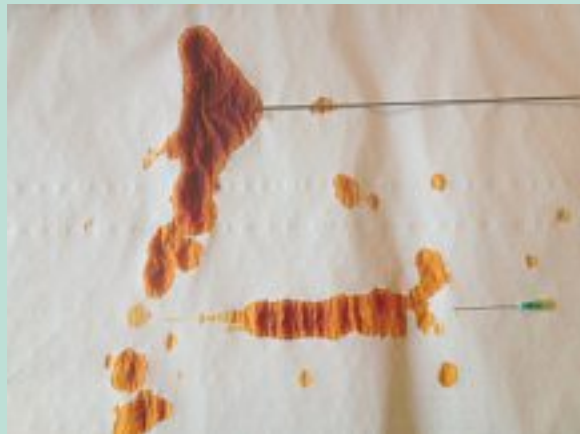
FIGURE 6 : Différence d'infiltration entre aiguille et canule de Klein : flux en jet frontal versus flux disséquant latéralement.