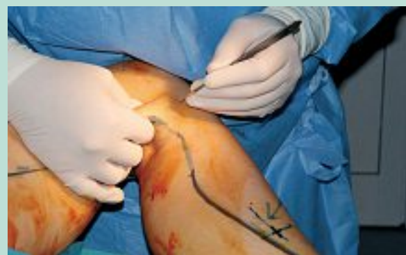
FIGURE 12 : Apprécier l'épaisseur de la couche sus-aponévrotique en pinçant la veine entre pouce et index ; ici 2 cm : la saphène se trouve à 1 cm. Noter la laxité tégumentaire, il faudra plus de tumescence.