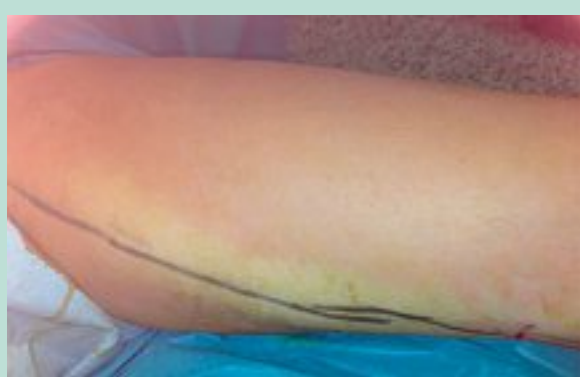
FIGURE 7 : Le vasospasme engendré par la tumescence à la lidocaïne adrénalinée (1/4 mg pour 500 cc de sérum et 400 mg de lidocaïne).

Lors d'interventions sur le réseau veineux, cette pression tissulaire perdure jusqu'à ce que le fluide soit complètement réabsorbé par le réseau capillaire, c'est-à-dire largement après la fin de l'intervention elle-même ; il n'y a pas de récupération des fluides injectés.