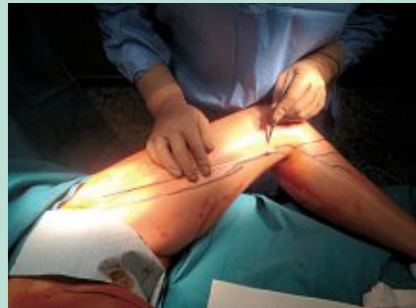
FIGURE 11 : Mesurer la distance jusqu'à la crosse moins 4 cm, voie d'introduction latéralement à la saphène 2 mm.