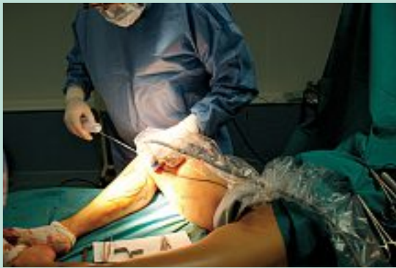
FIGURE 10 : Si utilisation de l'échographie, prendre toutes les précautions d'asepsie.

Cependant, certains auteurs ne l'utilisent pas. Ils doivent savoir dans ce cas que la lidocaïne est plus rapidement absorbée donc potentiellement plus toxique ( Klein – Vidal ) et que ce produit est bradycardisant (effet contrebalancé par l'adrénaline).