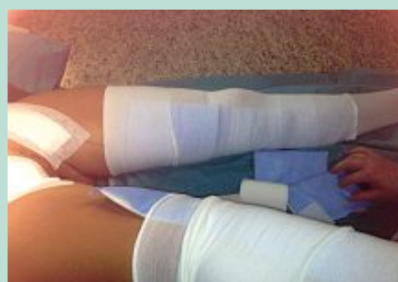
FIGURE 15 : Pose d'une contention avec pansement américain en regard du trajet sur tube compressif, qui sera recouvert d'une contention fixe élasto-compressive, à laisser en place 5 jours.