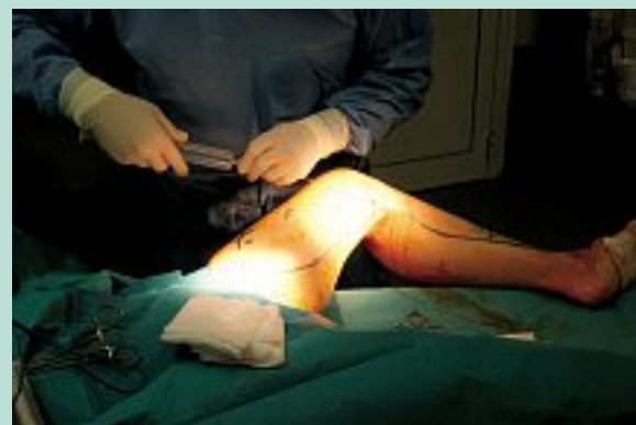
FIGURE 14 : Même chose vers le bas ; à ce niveau l'espace sus-aponévrotique et la sonde glissent dans la chemise de la veine, en dessinant son trajet jusqu'à la malléole.