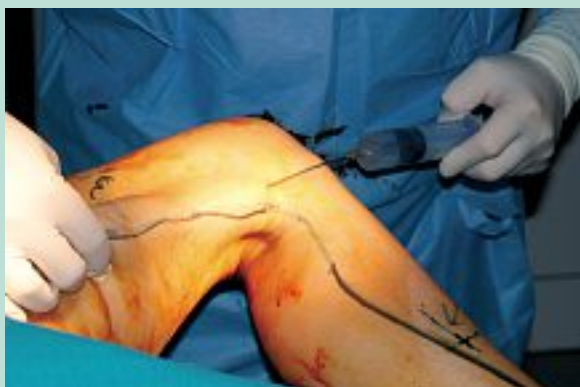
FIGURE 13 : Remonter vers la fosse inguinale en injectant en même temps.