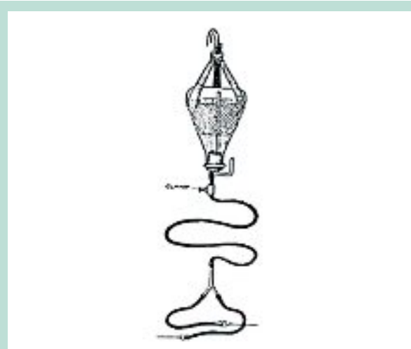
FIGURE 4 : Remplissage par gravité ressemblant au système « pieuvre ».