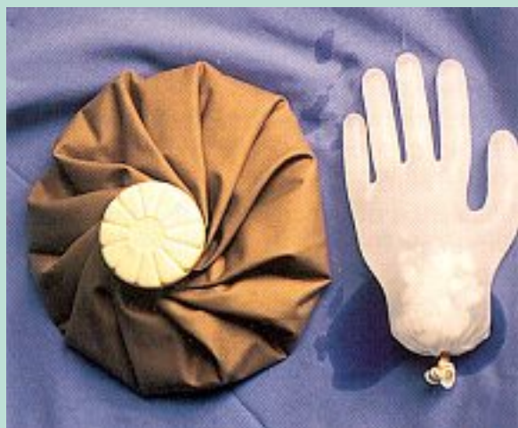
FIGURE 5 : Les vessies de glace qu'utilisent Fischer, Fournier et Illouz. Klein recommande une solution à 2°.