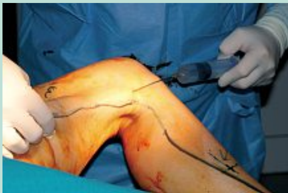
FIGURE 13 : Remonter vers la fosse inguinale en injectant en même temps.