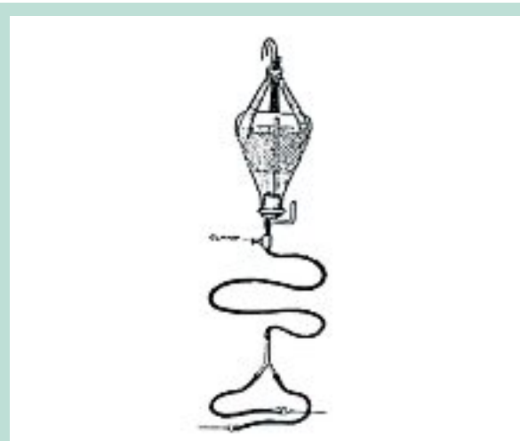
FIGURE 4 : Remplissage par gravité ressemblant au système « pieuvre ».