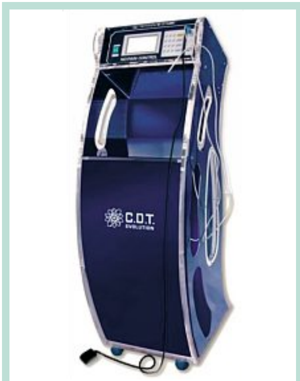
FIGURE 1 : Carbomed CDT Evolution.