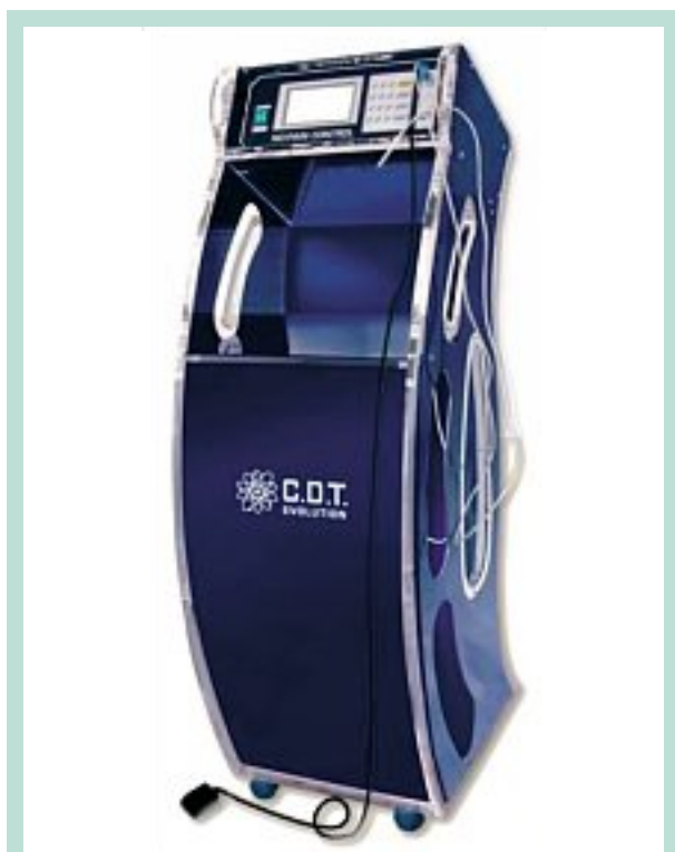
FIGURE 1 : Carbomed CDT Evolution.