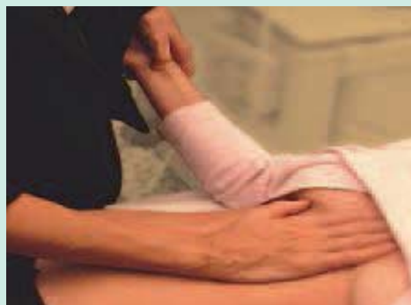
FIGURE 2 : Points importants des méridiens du cœur situés sur la main et l'avant-bras.