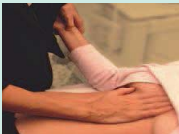
FIGURE 2 : Points importants des méridiens du cœur situés sur la main et l'avant-bras.