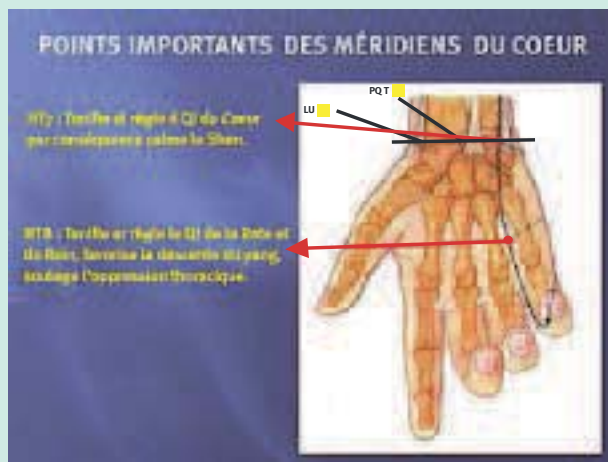
FIGURE 3 : Points importants des méridiens du cœur situés sur la main.