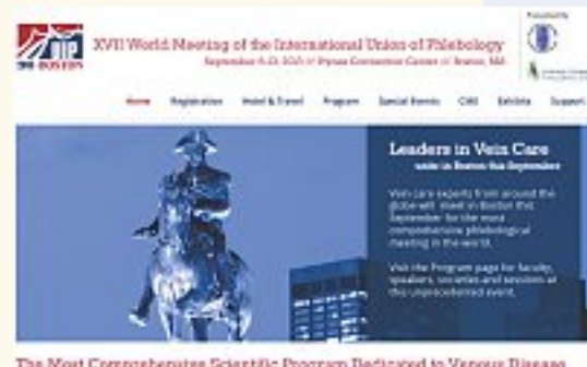
The Most Comprehensive Scientific Program Dedicated to Venous Disease