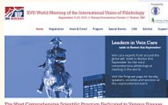
The Most Comprehensive Scientific Program Dedicated to Venous Disease