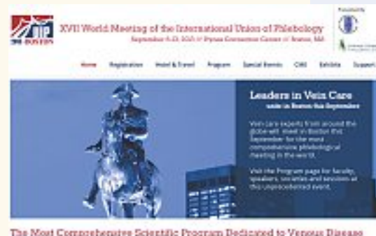
The Most Comprehensive Scientific Program Dedicated to Venous Disease