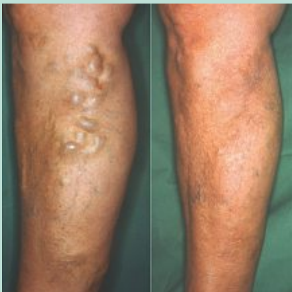
FIGURE 5 : Grosses varices de face interne de jambe (photo de gauche). Résultat 2 ans après phlébectomies (photo droite).