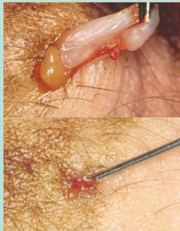
FIGURE 4 : Protrusion d'un lobule graisseux (photo du haut) et sa remise en place à l'aiguille (photo bas).

Avant le pansement, le nettoyage de la peau s'impose mais la fermeture des micro-incisions ne nécessite aucun geste car le pansement suffit à les collaber. Il prévient tout risque de saignement, mais il ne doit surtout pas entraver la circulation profonde. Il a en outre des fonctions antalgique, antiœdémateuse et antithrombotique.