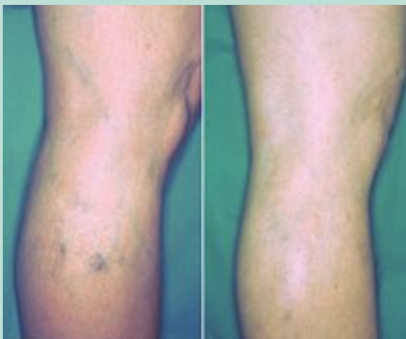
FIGURE 11 : Réseau diffus face externe du genou (Albanèse). Résultat à 1 an après une phlébectomie.

Elle relie les veines jumelles au réseau d'Albanèse. Il est important de la détruire afin d'obtenir un bon résultat.