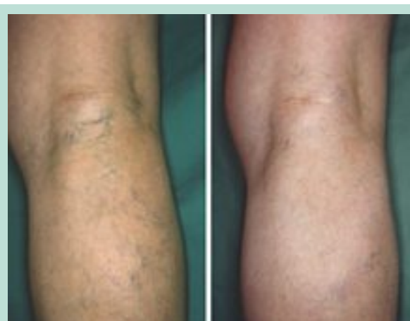
FIGURE 10 : Persistance de varices poplitées après stripping petite saphène. À droite, résultat à 5 ans après 2 phlébectomies complémentaires.

Il faut insister sur le fait que dans ces localisations on sera souvent amené à effectuer des séances itératives pour obtenir une éradication complète.