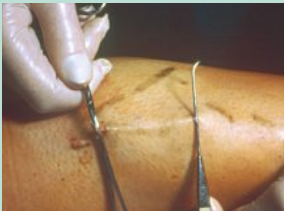
FIGURE 3 : Une traction sur la veine extraite dessine une corde sur la peau et à son extrémité on pratique l'incision suivante.

La veine, à sa sortie, apparaît comme une structure d'un blanc laiteux de consistance élastique sur laquelle on place une fine pince d'amarrage. On tire alors sur celle-ci, ce qui met sous tension le cordon variqueux qui soulève la peau comme une corde ( Figure 3 ).