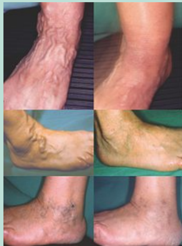
FIGURE 12 : Différents types de varices des pieds (photos de la colonne de gauche). Résultats après une phlébectomie ambulatoire (colonne de droite).

L'anesthésie est toujours laborieuse car le liquide de tumescence diffuse difficilement au pourtour des ulcères. L'exérèse au crochet fin ne ramène que de minuscules morceaux de l'ordre de quelques millimètres. La phlébectomie se contente alors de rompre délicatement au crochet ces riches réseaux veineux. Ces gestes difficiles et peu gratifiants pour l'opérateur apportent toujours une amélioration sur les troubles trophiques. Les ulcères régressent partiellement ou totalement ( Figure 13 ).