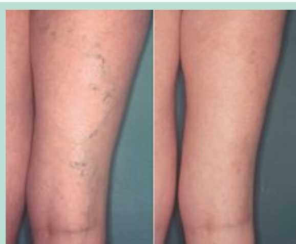
FIGURE 7 : Varices de petit calibre post-externe cuisse droite. À droite, résultat 2 ans après phlébectomie.