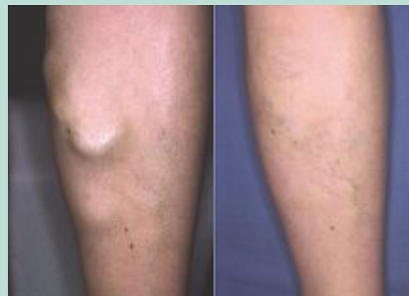
FIGURE 6 : Varice anévrysmale de face interne de jambe. À droite, résultat 2 ans après la phlébectomie.

Nous avons traité toutes les variétés de varices des membres inférieurs et de leurs complications. Voici les résultats obtenus.