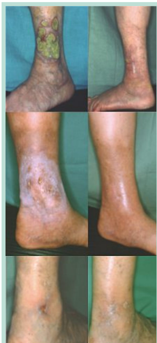
FIGURE 13 : Ulcères de jambe. Planche du haut : résultat (à droite) 1 an après trois phlébectomies. Planche du milieu : multi-ulcères avec diabète ; résultat (à droite) à 5 ans après trois phlébectomies. Planche du bas : résultat (à droite) 5 ans après trois phlébectomies.

En effet si un cordon extrait ne peut récidiver, la varicose par contre est une maladie évolutive et la phlébectomie ambulatoire ne peut la prévenir. C'est ainsi que l'on voit parfois apparaître au voisinage de régions déjà traitées une nouvelle poussée de varices. Ces dernières bien entendu peuvent bénéficier d'une nouvelle phlébectomie ambulatoire.