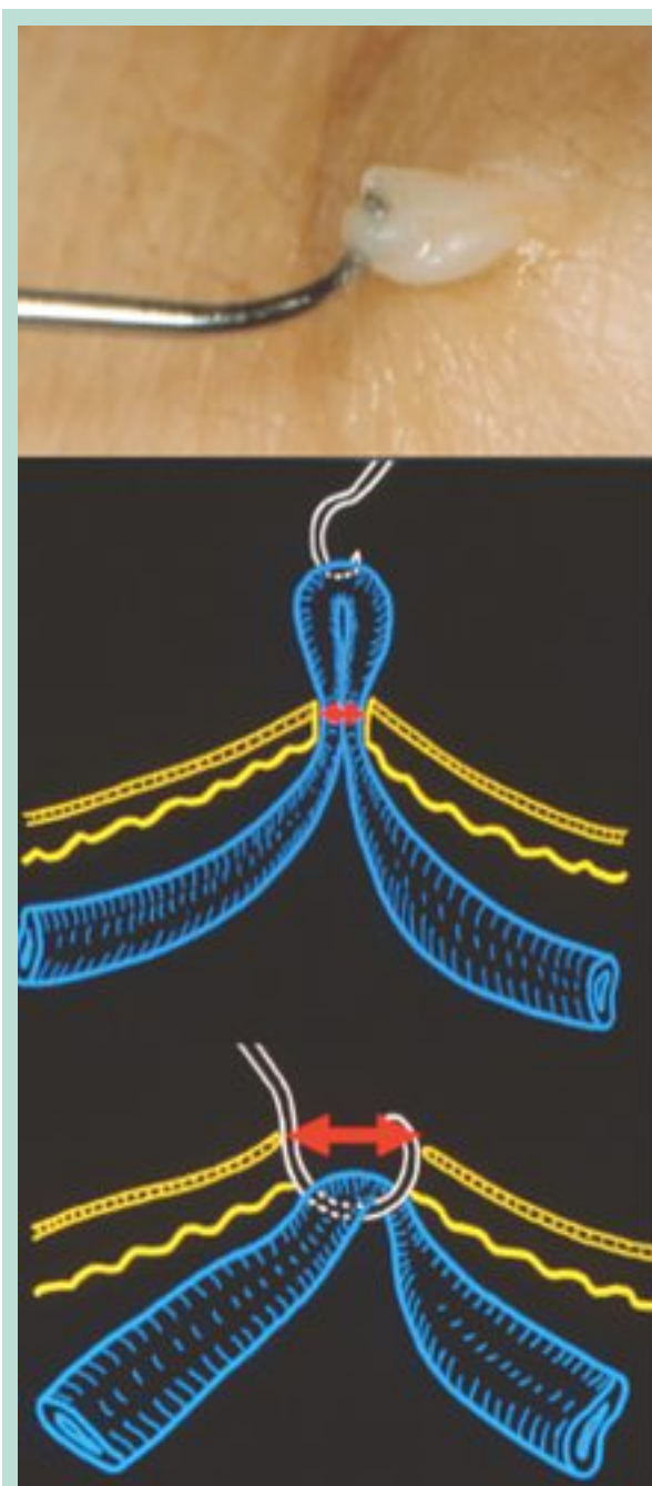
FIGURE 2 : La veine est agrippée par son adventice (photo haut) et « accouche » sans élargir le point de puncture (photo milieu), à la différence de l'extraction sur le crochet.

Cette manœuvre a comme inconvénient de provoquer un élargissement du pertuis cutané ( Figure 1 ) lequel se déchire, élargissant l'orifice de puncture.