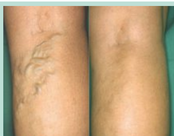
FIGURE 9 : Volumineux réseaux variqueux du creux poplité. À droite, résultat à 18 mois après deux phlébectomies.

Ces deux régions anatomiques sont étroitement liées par les connexions veineuses qui les relient et leurs alimentations sont très complexes, ce qui explique que le résultat de leur traitement classique, chirurgie, scléroses, est fréquemment grevé de récives. La phlébectomie ambulatoire nous a donné d'excellents résultats ( Figure 9 ) même sur des varices post-stripping ( Figure 10 ) ou post-scléroses.