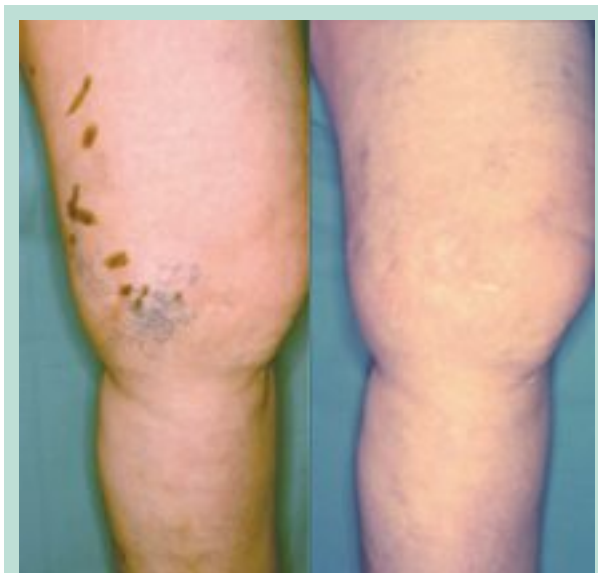
FIGURE 8 : Téliangiectasies face interne de genou et leur veine nourricière. À droite, résultat après phlébectomie.