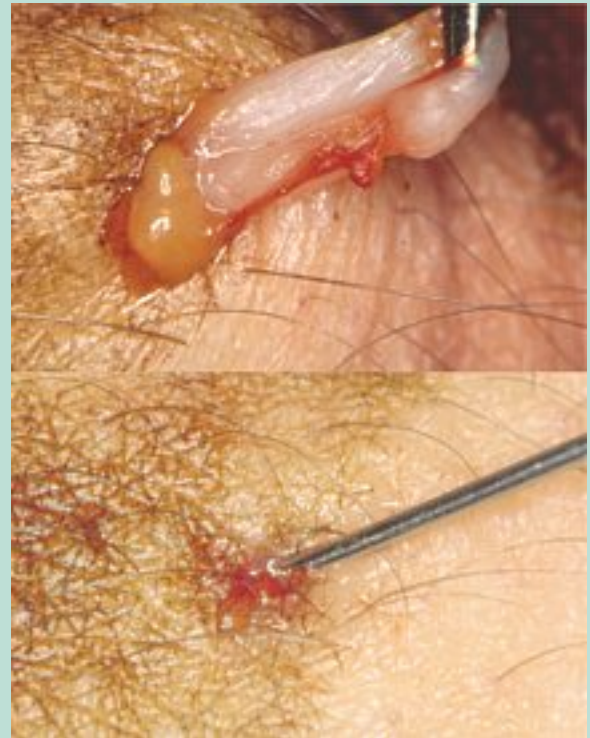
FIGURE 4 : Protrusion d'un lobule graisseux (photo du haut) et sa remise en place à l'aiguille (photo bas).

Avant le pansement, le nettoyage de la peau s'impose mais la fermeture des micro-incisions ne nécessite aucun geste car le pansement suffit à les collaber. Il prévient tout risque de saignement, mais il ne doit surtout pas entraver la circulation profonde. Il a en outre des fonctions antalgique, antiœdémateuse et antithrombotique.