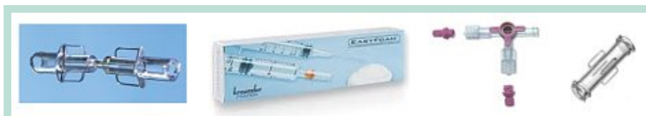
FIGURE 7 : Différents types de raccords double femelle.

De plus les mouvements alternatifs nombreux (entre 10 et 20) nécessaires à ce type de moussage ramènent davantage encore de silicone au sein de la solution moussante.