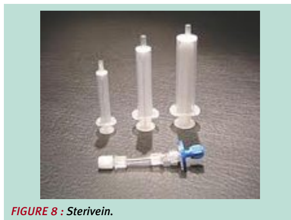
FIGURE 8 : Sterivein.

Pour mieux expliquer et/ou comprendre l'intérêt récent de la communauté phlébologique pour les mousses sclérosantes, il faut vraiment avoir à l'esprit ce que représente l'utilisation d'un sclérosant liquide transformé sous forme de mousse [2].