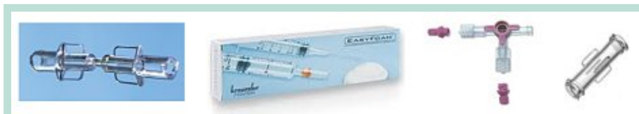
FIGURE 7 : Différents types de raccords double femelle.

De plus les mouvements alternatifs nombreux (entre 10 et 20) nécessaires à ce type de moussage ramènent davantage encore de silicone au sein de la solution moussante.