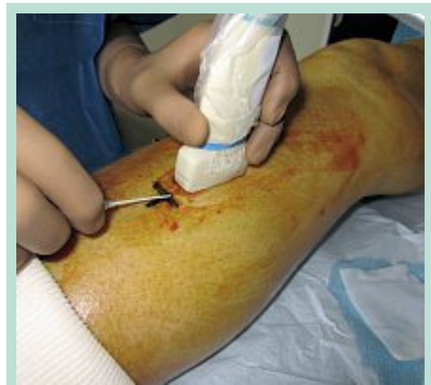
FIGURE 4 : Point d'accès pour procédure AT.

Cette hétérogénéité trouve peut-être une explication dans le choix du point d'accès pour la réalisation de l'AT.