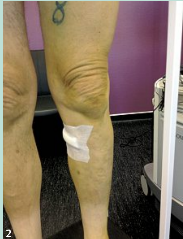
FIGURE 6 : Monsieur M. Affaissement des varices tributaires en post-procédure immédiat.