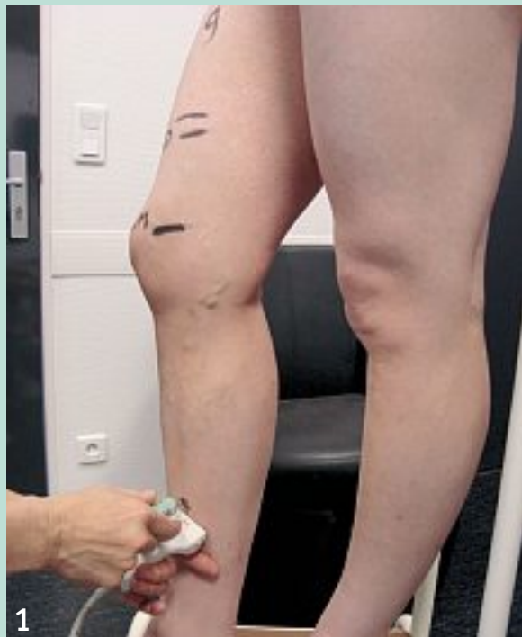
FIGURE 5 : Madame L. Choix du point d'accès plus bas que l'abouchement des grosses tributaires.