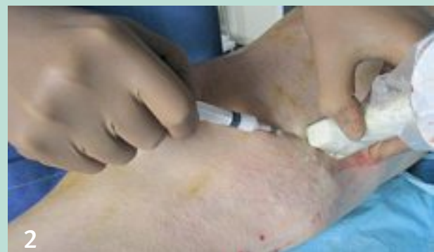
FIGURE 7 : Monsieur C. ESM en fin de procédure AT, en raison d'un affaissement de varices tributaires.