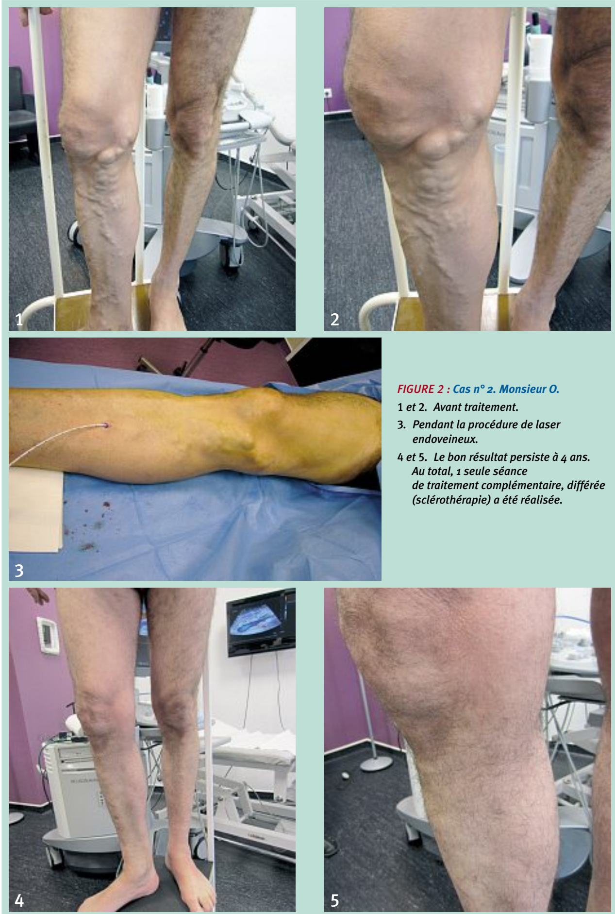
FIGURE 2 : Cas n° 2. Monsieur O. 1 et 2. Avant traitement. 3. Pendant la procédure de laser endoveineux. 4 et 5. Le bon résultat persiste à 4 ans. Au total, 1 seule séance de traitement complémentaire, différée (sclérothérapie) a été réalisée.