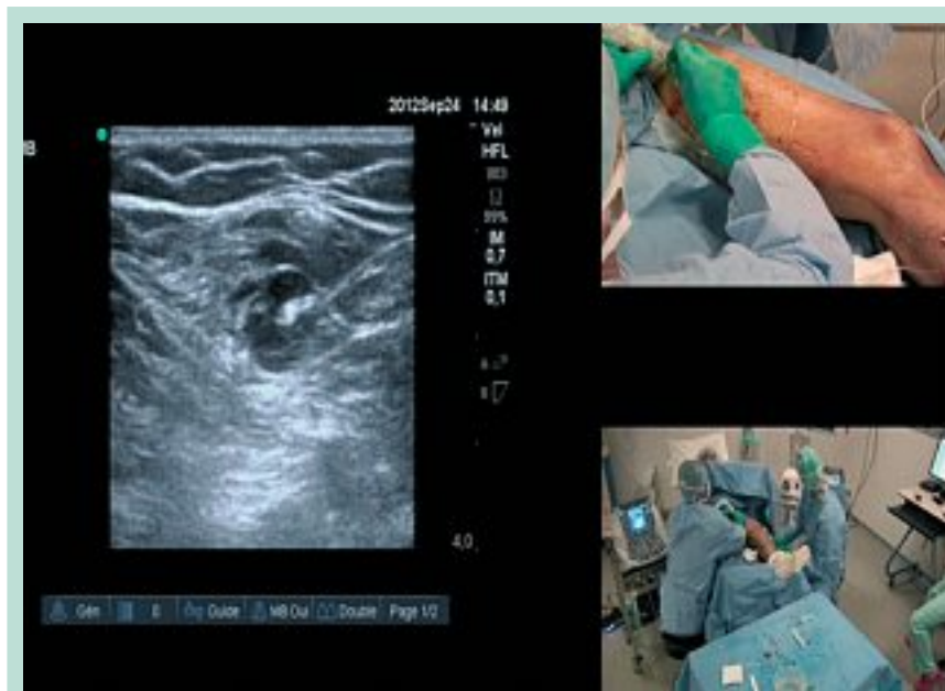
FIGURE 2 : Tumescence sous guidage échographique avec réalisation d'un manchon liquidien hypo-échogène entraînant un spasme de la veine autour de la fibre laser.