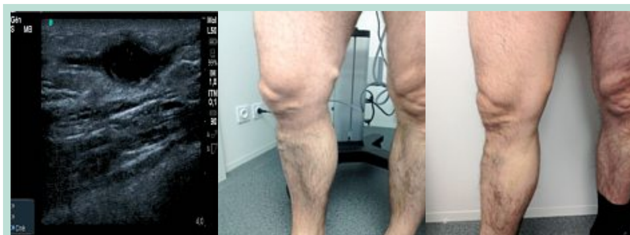
FIGURE 3 : Ectasie varicueuse franchie par laser endoveineux avant traitement et 8 jours après traitement.

La tumescence est également un élément qui permet d'augmenter cette distance.