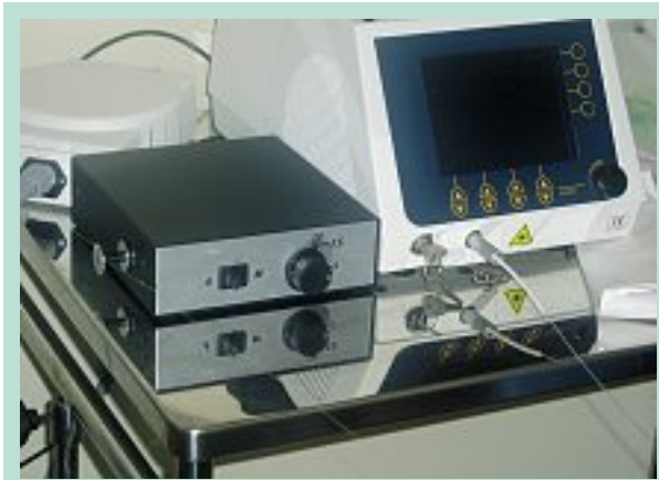
FIGURE 10 : Mini treuil électrique pour le retrait continu et motorisé d'une fibre laser, 2004.