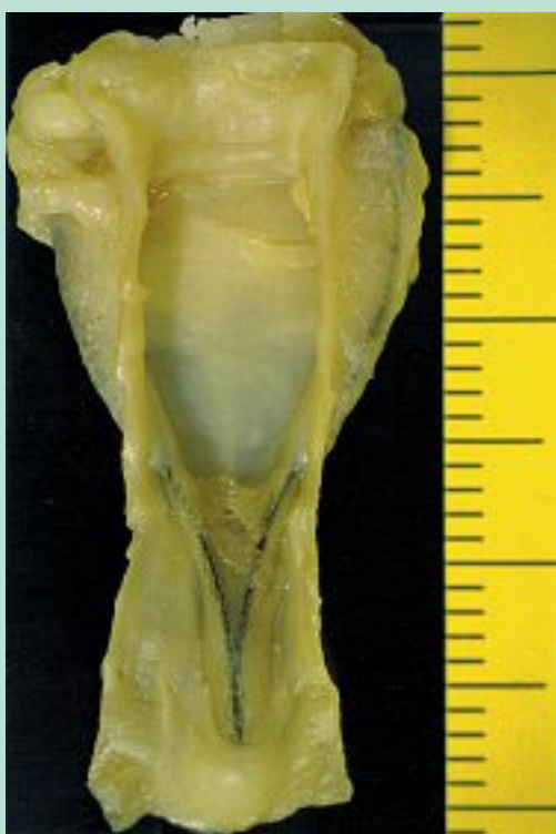
FIGURE 8 : V Clip endosaphène, obstruction par aplatissement, 1992.