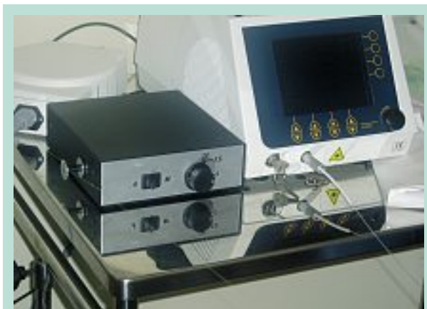
FIGURE 10 : Mini treuil électrique pour le retrait continu et motorisé d'une fibre laser, 2004.