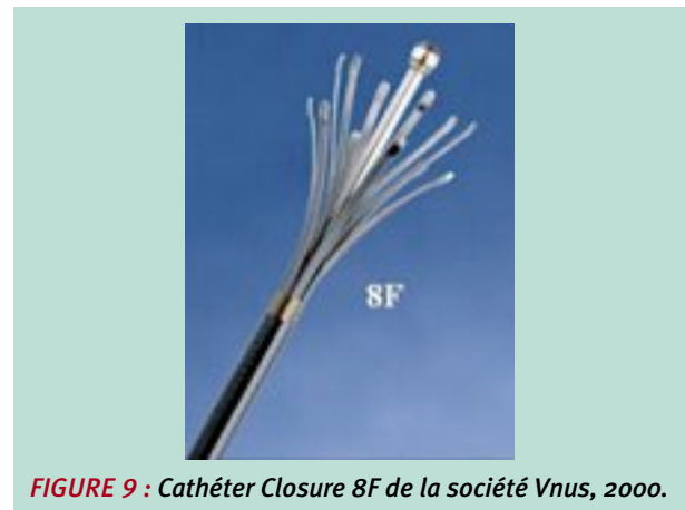
FIGURE 9 : Cathéter Closure 8F de la société Vnus, 2000.

Les premiers cathéters de 6 ou de 8F commercialisés comportaient plusieurs électrodes bipolaires.