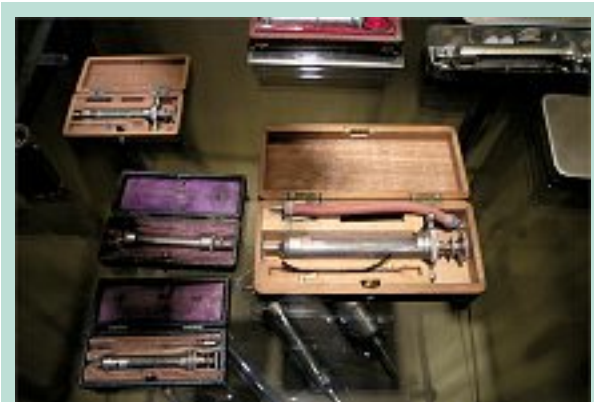
FIGURE 11 : Seringues du XIX e siècle. Musée histoire de la médecine, Paris.

Rapide, efficace, pas cher et ne perturbant pas la vie quotidienne du patient, telle sera la technique du futur.