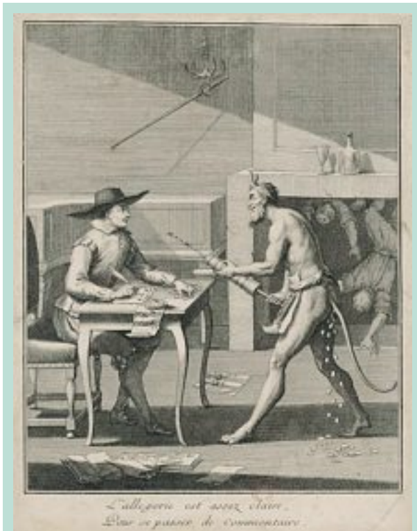
FIGURE 3 : Estampe vers 1737.

Vers 1950, la société Sedat Pérouse médical à Irigny fabrique des seringues en plastique stérilisables et réutilisables ; puis la seringue jetable deux ou trois pièces avec joint de silicone s'impose.