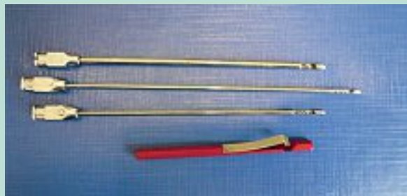
FIGURE 7 : Canules de phlébo-aspiration, 1986.