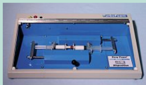
FIGURE 6 : Machine standardisant le va-et-vient pour la fabrication de la mousse, 2004