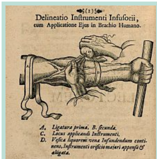
FIGURE 1 : Technique d'infusion en 1664.

En 1661, J.S. Elscholtz injecte à l'aide d'une canule et d'une poire de l'eau de plantain (modeste plante des prairies) à trois soldats victimes d'abcès ou de scorbut et qui guérissent. C'est l'infusion médicamenteuse que l'on pratique généralement après dénudation de la veine [3].