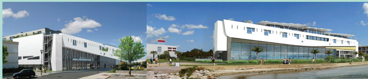
FIGURE 1 : Nouvel établissement thermal de Balaruc-les-Bains.

L'inclusion des patients dans l'étude n'a modifié ni la prise en charge, ni le rythme des soins thermaux habituels. Les équipes soignantes n'étaient pas au courant de l'étude et ne pouvaient avoir connaissance des patients inclus. Les patients n'ont perçu aucune indemnité financière en contrepartie de leur participation à l'étude.