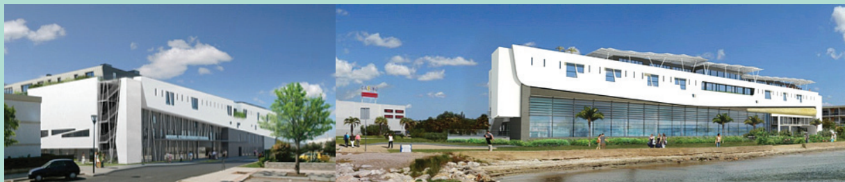
FIGURE 1 : Nouvel établissement thermal de Balaruc-les-Bains.

L'inclusion des patients dans l'étude n'a modifié ni la prise en charge, ni le rythme des soins thermaux habituels. Les équipes soignantes n'étaient pas au courant de l'étude et ne pouvaient avoir connaissance des patients inclus. Les patients n'ont perçu aucune indemnité financière en contrepartie de leur participation à l'étude.