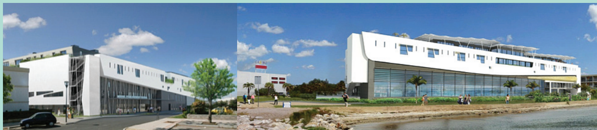
FIGURE 1 : Nouvel établissement thermal de Balaruc-les-Bains.

L'inclusion des patients dans l'étude n'a modifié ni la prise en charge, ni le rythme des soins thermaux habituels. Les équipes soignantes n'étaient pas au courant de l'étude et ne pouvaient avoir connaissance des patients inclus. Les patients n'ont perçu aucune indemnité financière en contrepartie de leur participation à l'étude.