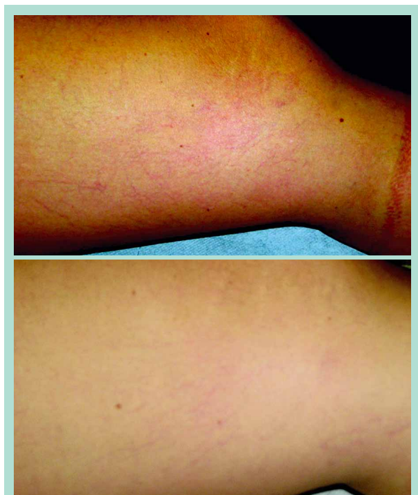
FIGURE 3 : Télangiectasies de type C (haut), 12 mois après 10 séances de LIDS (bas).