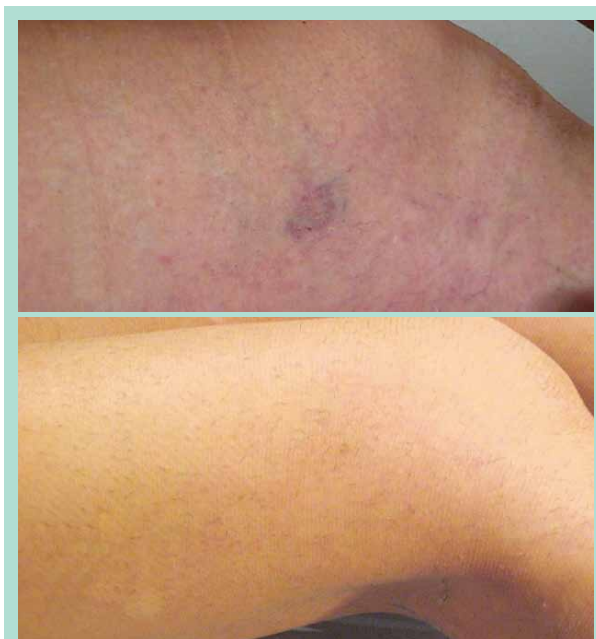
FIGURE 2 : Télangiectasies de type B (haut), 6 mois après une seule séance de START (bas).