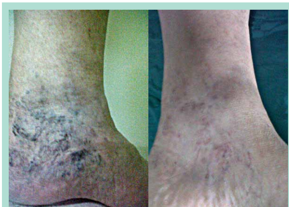
FIGURE 1 : Télangiectasies de type A, en rapport avec un reflux de GVS (gauche), 6 mois après la sclérothérapie de la GVS (droite).