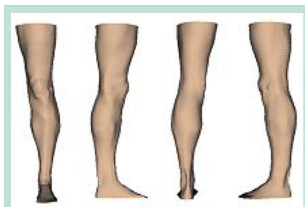
FIGURE 1 : Vue des faces antérieure, médiale, postérieure et latérale du Scan 3D du sujet de l'étude.

L'ensemble des lois tension-déformation obtenues pour un BCM, ainsi que les dimensions de celui-ci, forment un fichier de données qui permet de définir un BCM virtuel, utilisable pour les simulations numériques.