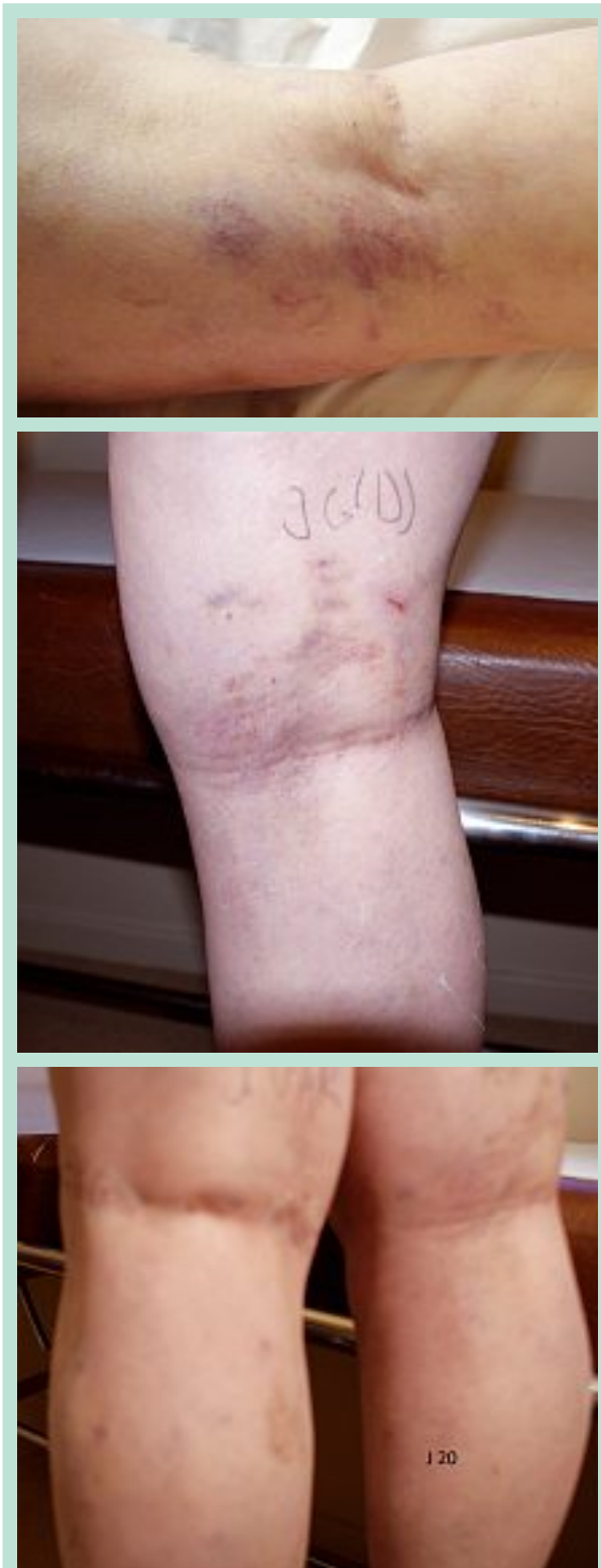
PHOTO 10 : Clichés comparatifs après différentes périodes ; voir les tableaux 1, 2, 3 et 4.