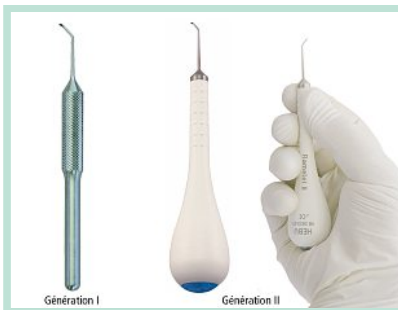
FIGURE 1 : Crochets à phlébectomie de Ramelet, 1 re et 2 e génération. L'ardillon pointu, acéré, se prête bien aux indications particulières de la phlébectomie. La tige du crochet se décline en deux tailles. Le crochet n° 1 (extrémité bleue) est le plus adéquat pour saisir de petites structures, comme les veines du visage, les kystes...