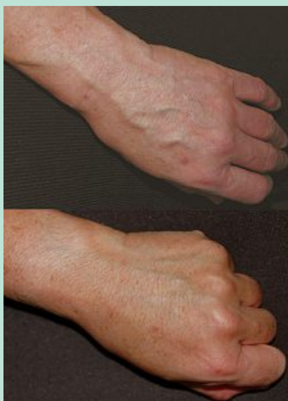
FIGURE 5 : Phlébectomie de veines dilatées du dos de la main. Avant et quelques semaines après phlébectomies.

En dehors de rares cas symptomatiques (lorsque les bras sont ballants), l'indication à une phlébectomie est purement esthétique : bras, avant-bras ( Figure 4 ), dos des mains ( Figure 5 ). Alternative à la sclérothérapie [13], la phlébectomie est une solution élégante à une telle demande [14]. La compression postopératoire est importante au cours des premiers jours, en particulier pour prévenir un œdème du dos de la main.