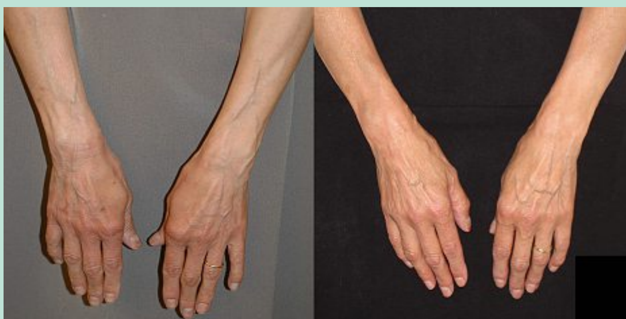
FIGURE 4 : Phlébectomie de veines dilatées des avant-bras. À gauche : avant l'intervention. À droite : 4 ans après les phlébectomies. Le dos des mains n'a pas été traité, car la plainte n'était pas esthétique, mais symptomatique. La patiente souffrait de douleurs le long des trajets veineux les bras ballants. Les plaintes ont totalement disparu après l'intervention et le résultat est stable à long terme !