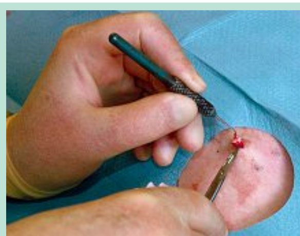
FIGURE 6 : Crochet à phlébectomie et kystes. Une fine incision est pratiquée au dessus du kyste, dont on exprime éventuellement le contenu pour réduire sa taille. Le crochet acéré permet de saisir la paroi du kyste et de l'énucléer.

Les veines prélevées lors d'une phlébectomie peuvent être introduites dans les rides ou une dépression cutanée pour les combler avec un greffon autologue. La veine prélevée est introduite entre deux fines incisions, par lesquelles on la fait coulisser pour la mettre en place et effacer la ride. On peut aussi insérer des fragments veineux obtenus au cours d'une phlébectomie, après les avoir dénaturés pour détruire leurs cellules endothéliales [18].