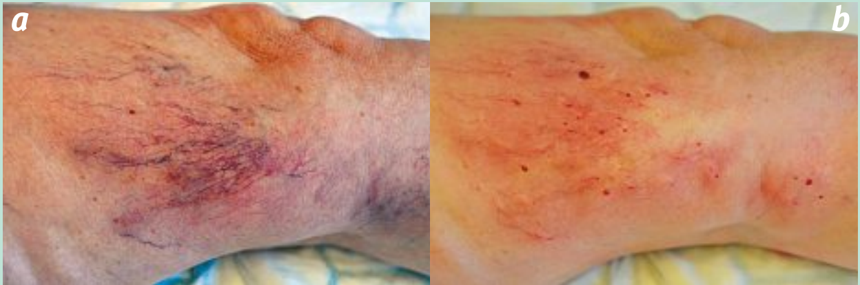
FIGURE 2 : Télangiectasies réfractaires.