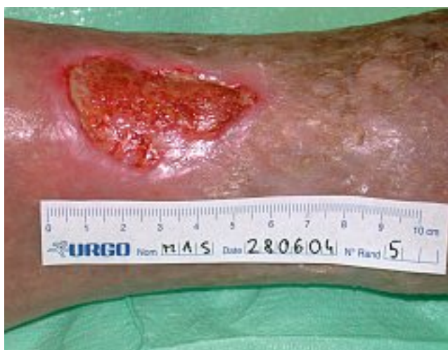
Photo 3. – Début de traitement, J0 (Patient B)