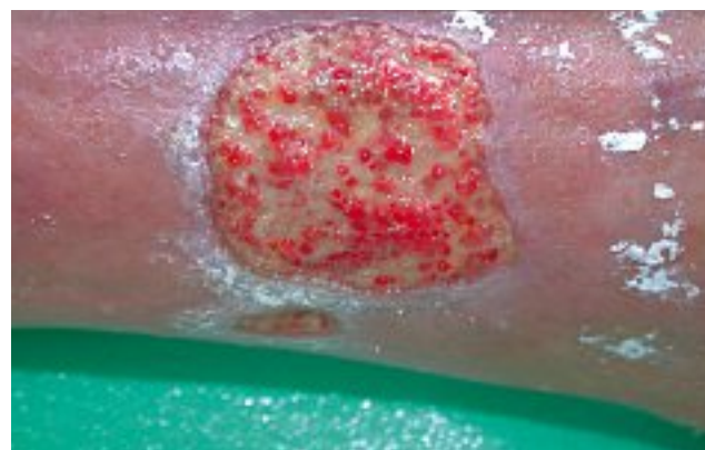
Photo 1. – Début de traitement, JO (Patient A)

Par ailleurs, les ulcères présentent à l'inclusion, un caractère douloureux modéré à important dans 37 % des cas.