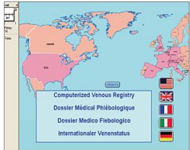
Fig. 1. – Fenêtre d'ouverture du programme CVR

Les données CEAP sont constituées par : les signes Cliniques qui sont répartis en 7 classes, de C0 à C6. Le C0 correspond à l'absence de signe, C6 au signe ultime qui est l'ulcère en phase évolutive (Tableau 1). Pour les symptômes, l'indice S (Symptomatique) ou A (Asymptomatique) positionné à la suite du numéro de la Classe, permet d'individualiser leur présence ou leur absence. Les trois autres composants de CEAP sont :