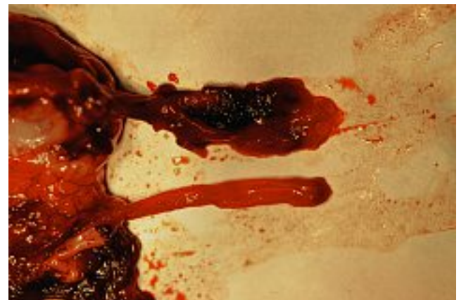
Photo 4. – Brûlure du tissu périverneux par le laser (veine jugulaire de porc)

Rares, transitoires, elles sont liées à une brûlure du tissu périverneux, donc à une diffusivité excessive de la chaleur au-delà de la paroi veineuse, conduisant aux mêmes effets secondaires que le classique stripping (Photo 4).