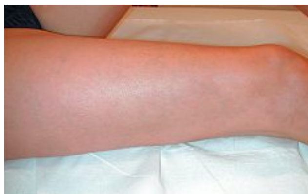
5 semaines après traitement