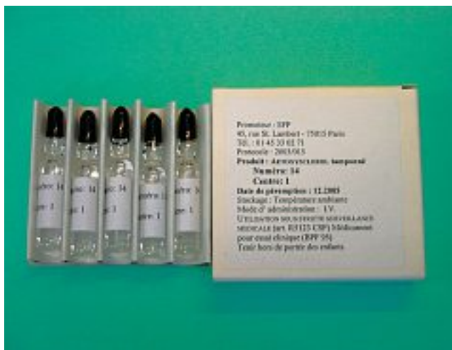
Photo 3. – Ampoules d'Aetoxiscéro® (polidocanol) Lots randomisés, double aveugle