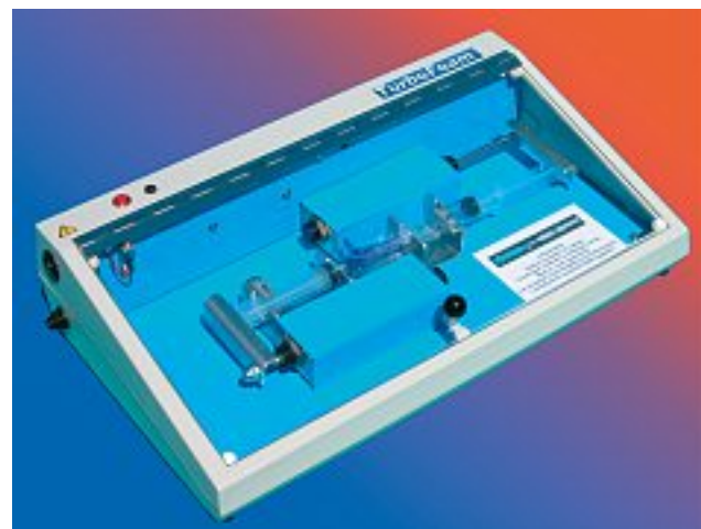
Photo 5. – Turbofoam® Machine pour la fabrication automatisée de mousse