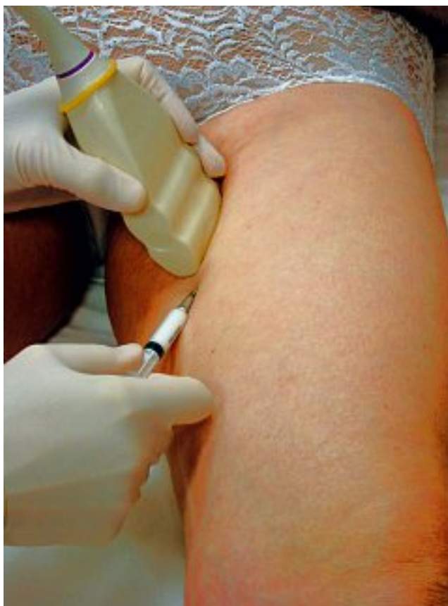
Photo 4. – Échoscloérotérapie de grande veine saphène (ponction injection directe à l'aiguille)