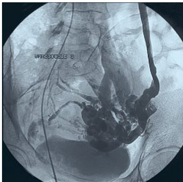
Fig. 1. – Varicocèle gauche type 1 secondaire à une pathologie de reflux du sang veineux rénal gauche dans la veine ovarique gauche. Noter l'opacification homogène de la veine rénale gauche sur tout son trajet