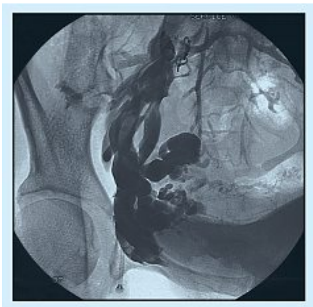
Fig. 6. – Dilatation globale des afférents iliaques internes droits dans le cadre d'une insuffisance veineuse pelvienne globale

Le traitement des varices issues des afférents iliaques internes est très récent [11]. Il est plus dangereux compte tenu de la possibilité d'expulsion du matériel injecté au début de la procédure et des multiples connexions. Pour éviter tous risques d'embolie pulmonaire, le traitement des afférents iliaques internes de gros diamètre (supérieur à 4 mm) à l'origine de varices pelviennes commence par un arrêt de sécurité à l'émergence de la fuite phlébographique. Celui-ci est réalisé par mise en place à l'aide d'une sonde 4 Fr de un ou deux coils en platine fibrés 0,035 ; ces coils sont franchis par micro-cathéter permettant le cathétérisme puis l'embolisation des varices par injection de colle. Les points de fuite de petit calibre (< 4 mm) sont embolisés par la pose de micro coils fibrés 0,018 sur toute la longueur de la fuite. Les points de fuite directs de gros calibre nécessitent l'utilisation de coils en platine fibrés 0,035 et parfois de colle prise en sandwich entre les coils posés au pôle proximal et distal de la fuite.