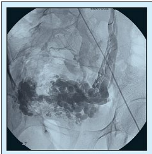
Fig. 3. – Varicocèle type 3 secondaire à une cause locale : syndrome de Masters-Allen (associé à une pathologie de reflux). Opacification faible et tardive des voies de drainage contrastant avec l'importance des varices génitales

tion à une varicocèle est possible (Fig. 5). La disparition de la symptomatologie nécessitera le traitement de la totalité des secteurs atteints. Enfin le SCP est parfois secondaire à une anomalie constitutionnelle du drainage pelvien ou à une insuffisance veineuse globale du pelvis responsable d'une dilatation de l'ensemble des afférents iliaques internes (Fig. 6), de stase et de varices.