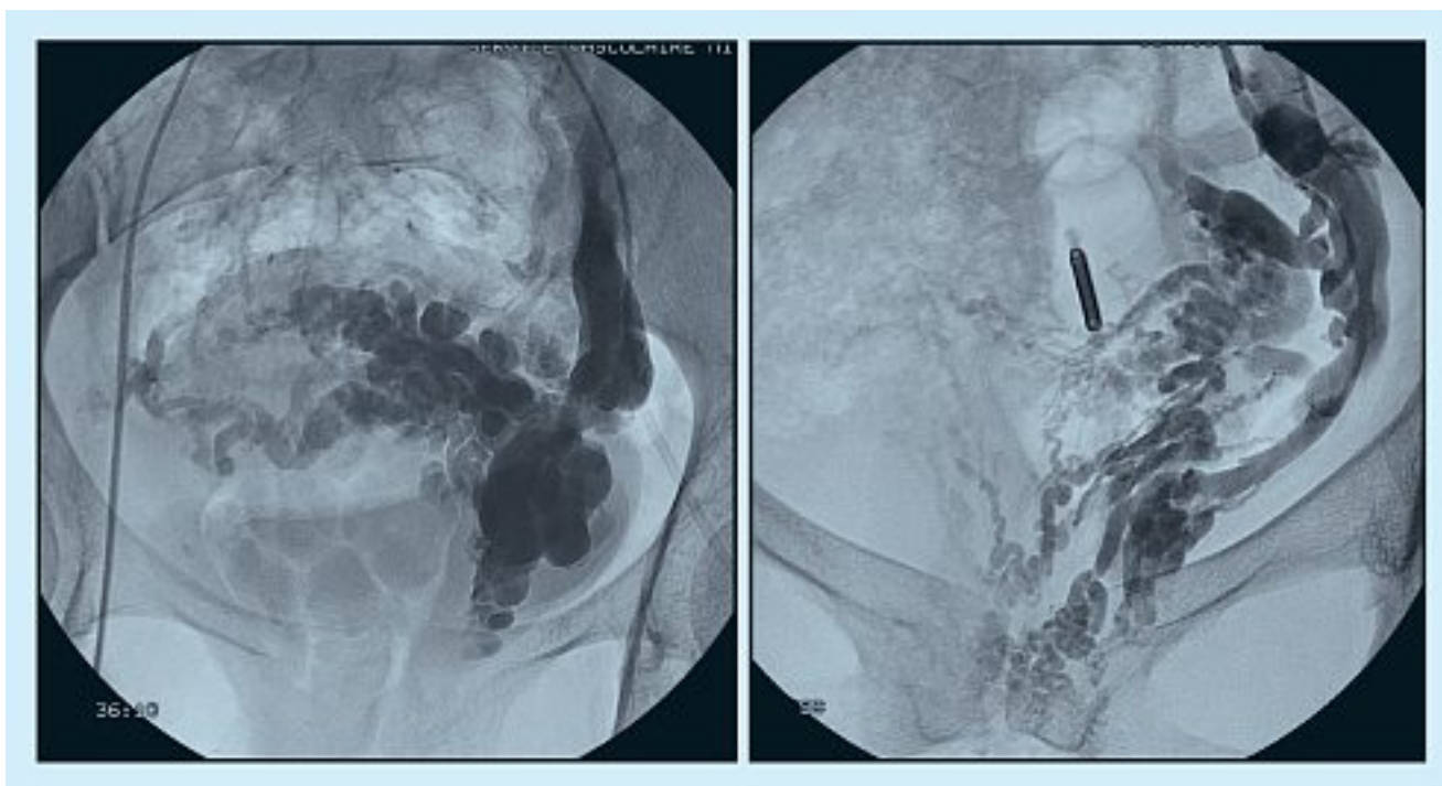
Fig. 4. – Varices pudendales internes gauches

Le traitement des varicocèles a été rapporté dans de nombreux articles [8-10]. La technique que nous utilisons préférentiellement exige une bonne maîtrise des colles chirurgicales qui polymérisent en quelques secondes au contact du sang pour former un conglo-mérat imperméable à toutes substances organiques. Le résultat est définitif. Elle associe des coils permettant de bloquer le flux des principaux afférents ovariens au paramètre suivi, après constatation de la stase du flux par injection à la main d'une faible quantité de produit de contraste, de l'embolisation de la veine génitale par une émulsion de colle chirurgicale et de lipiodol. Les afférents iliaques internes incontinents injectant la varicocèle sont également embolisés.