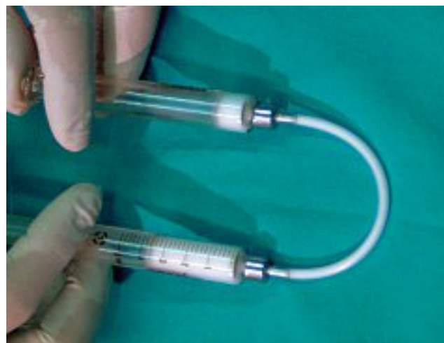
Fig. 1. - Préparation de la micromousse : 1 ml de médicament est mélangé avec 4 ml d'air avec des passages alternés d'une seringue en verre à l'autre

Keywords : foam, sclerotherapy of telangiectasies.