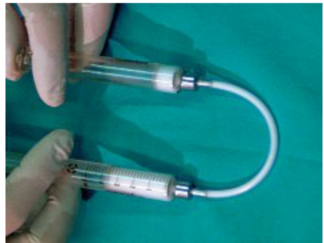
Fig. 1. - Préparation de la micromousse : 1 ml de médicament est mélangé avec 4 ml d'air avec des passages alternés d'une seringue en verre à l'autre

Keywords : foam, sclerotherapy of telangiectasies.