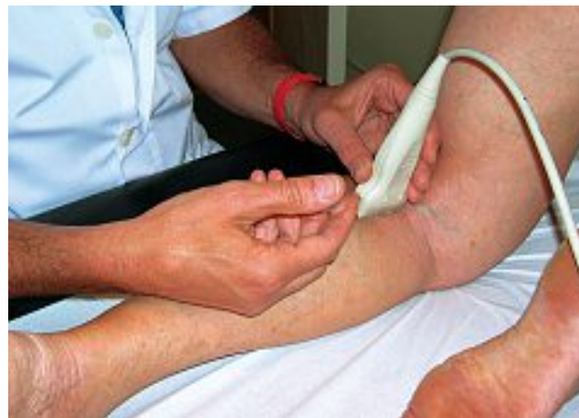
Photo 3. – Injection de la petite veine saphène sous contrôle écho-guidé

présentée avec R. Knight, lors du Congrès mondial de Strasbourg en 1989 [7]. L'échographie faisait son apparition dans la pratique phlébologique et, compte tenu du nombre d'accidents d'injections intra-artérielles constatées chez des praticiens expérimentés, l'idée nous est venue de sécuriser cette injection. Réalisée sous contrôle écho-guidé, elle permettait d'avoir un double contrôle : un contrôle clinique par reflux de sang dans la seringue et un contrôle échographique avec visualisation de l'aiguille dans la lumière veineuse et du passage du produit sclérosant dans la lumière veineuse.