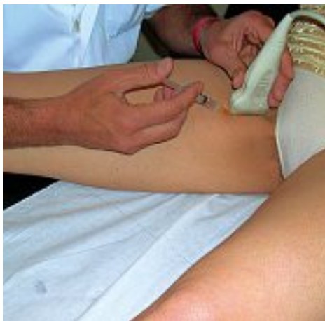
Photo 2. – Injection de la grande veine saphène sous contrôle écho-guidé