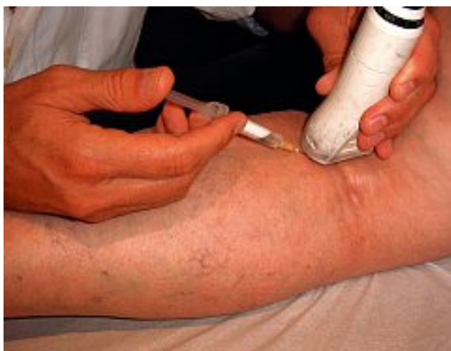
Photo 5 – Injection sous contrôle écho-guidé de mousse dans la petite veine saphène

Le site d'injection est par contre, comme pour la grande saphène, différent. Il se situe à l'union du 1/3 supérieur et des 2/3 inférieurs (Photo 5) de façon à visualiser le passage de la mousse en aval du site d'injection jusqu'à la jonction saphéno-poplitée puis en amont.