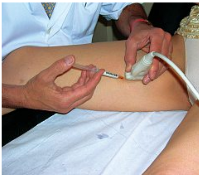
Photo 4. – Injection sous contrôle écho-guidé de mousse dans la grande veine saphène

gressivement en aval puis en amont du point de ponction.