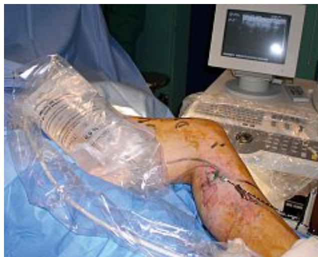
Photo 2 – Sac de compression sur la cuisse en regard de la saphène