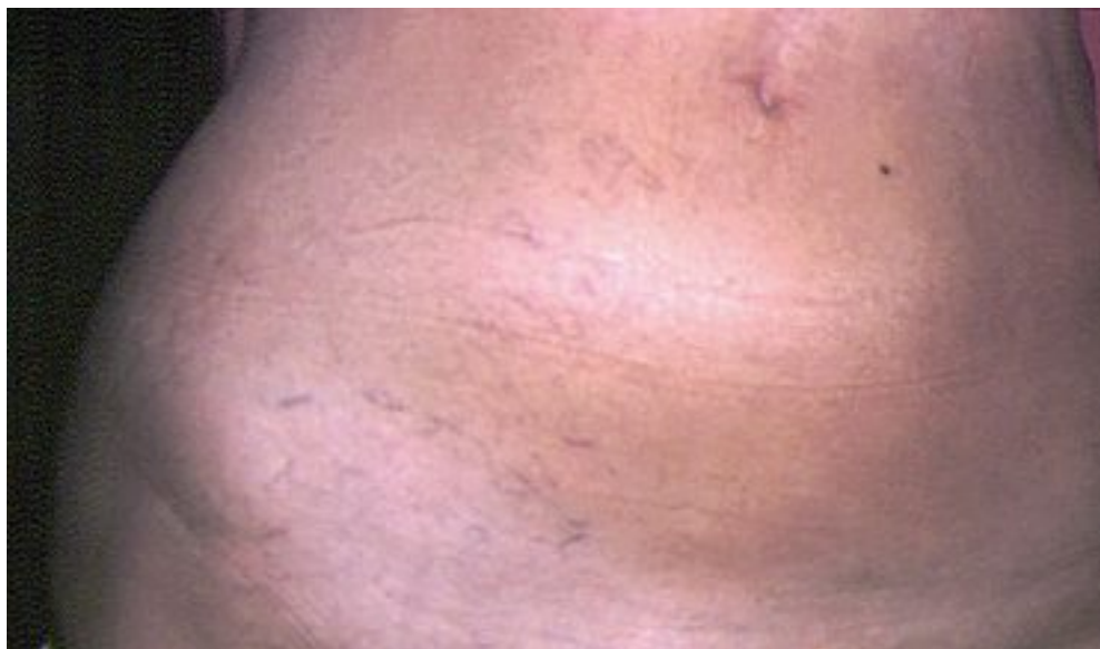
Photo 2. – Varicosités sur l'hémi-abdomen apparues chez une jeune patiente quelques mois après une crossectomie

L'expérience nous montre que les exérèses intensives de varices et de tronc de drainage ne protègent pas toujours le patient du risque de récurrence, loin s'en faut. Nous avons tous à l'esprit l'image de patients présentant des varices bilatérales, multi-opérés, d'un côté seulement depuis plusieurs dizaines d'années et qui présentent une asymétrie spectaculaire de résultat avec un bien meilleur état veineux du côté qui n'a pas encore été opéré pour des raisons parfois non médicales. L'étude des résultats à 5 ans de patients opérés de récurrences dans le territoire de la grande veine saphène, chez qui avait été pratiquée une exérèse complète des varices ainsi que des troncs résiduels quand ils existaient, a montré le mauvais pronostic inévitable des patients qui ne présentent plus de voies de drainage [37]. En effet, dans cette étude, les patients qui présentaient des varices diffuses et aucun tronc saphène de drainage avaient les plus mauvais résultats (72 % étaient toujours porteurs de varices à 5 ans après une exérèse de varices pourtant complète). On peut rapprocher ces mauvais résultats de ceux de Cappelli [38] constatés à 5 ans chez les patients opérés selon la méthode de CHIVA et qui présentaient un tronc saphène non drainé (69 % étaient toujours porteurs de varices). L'apparition de varicosités postopératoires survenant quelques mois après l'intervention, majorée chez la femme en activité hormonale [24], correspond probablement aussi à ce manque de drainage (Photo 2).