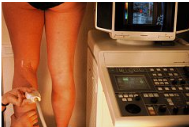
Photo 1. – Examen échographique et Doppler veineux des membres inférieurs