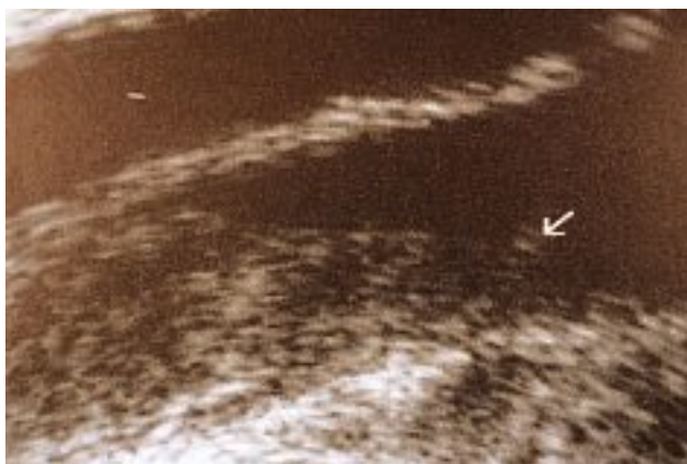
Photo 3. – Le pôle supérieur du thrombus s'arrête à l'abouchement d'une veine collatérale

moyen de les appréhender est de raisonner en termes d'équilibre : une balance avec d'un côté les facteurs favorisant la formation du thrombus et, de l'autre, les facteurs inhibiteurs ou compensateurs empêchant la formation de ce thrombus.