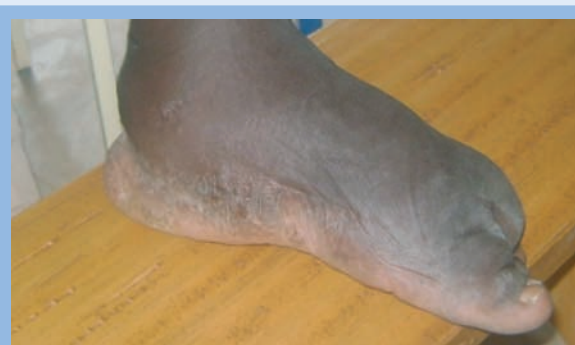
FIGURE 7 : Même pied que Figure 2, début juin 2009.